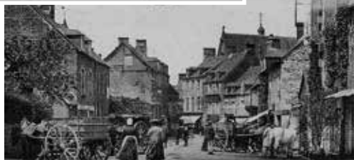
La Carneille, un jour de marché (market day)