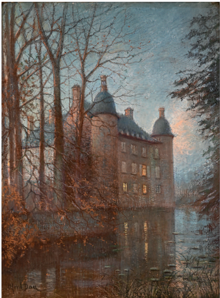
Alfred Dan, château de Flers effet de nuit