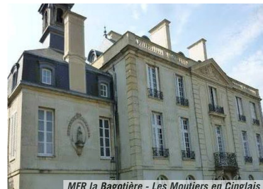
MFR la Bagotière - Les Moutiers en Cinglais