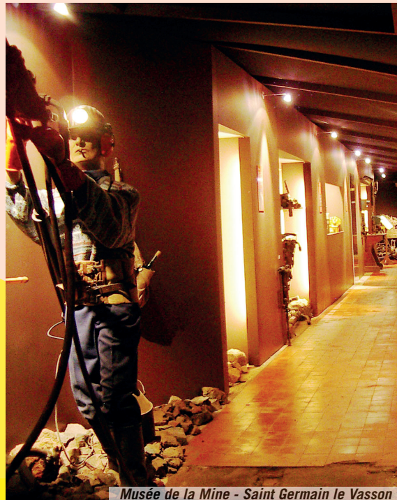
Musée de la Mine - Saint Germain le Vasson