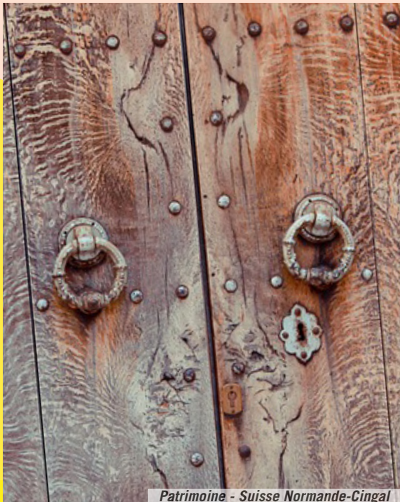
Patrimoine - Suisse Normande-Cingal