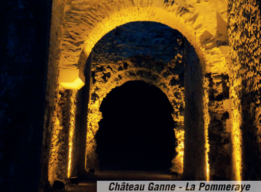
Château Ganne - La Pommeraye