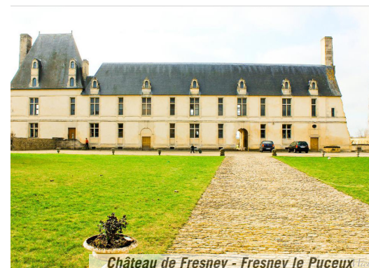
Château de Fresney - Fresney le Puceux