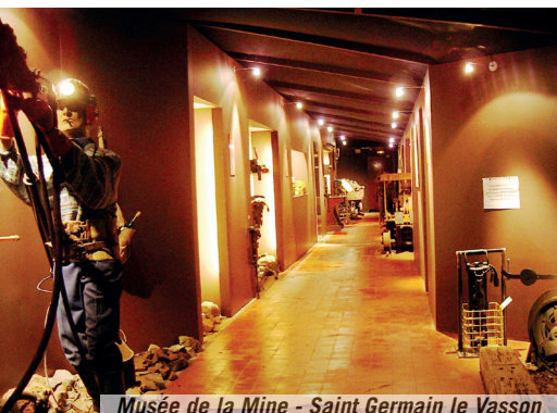
Musée de la Mine - Saint Germain le Vasson

>>BARBERY - Grand Tremblay - Site de fouilles archéologiques Ferme avec tuilerie monastique. Fouille archéologique des tuileries médiévales et modernes de Barbéry Résa : jbarcheo@yahoo.fr - samedi 14h à 17h dimanche 10h à 13h.