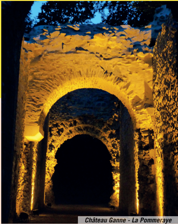
Château Ganne - La Pommeraye