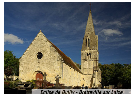
Eglise de Quilly - Bretteville sur Laize