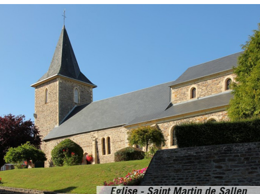
Eglise - Saint Martin de Sallen