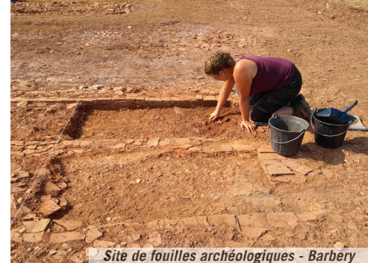
Site de fouilles archéologiques - Barbéry

>>URVILLE - Eglise Renseignements 07 82 80 01 40 Samedi - Dimanche 10h à 18h Exposition de peinture, vente d'un tableau au profit de l'église, concert instrumental le dimanche à 15h30, visite du 1er étage du clocher.