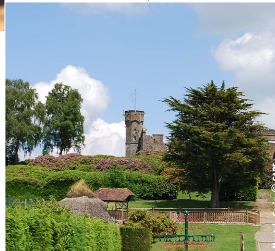
Mont de Cerisy