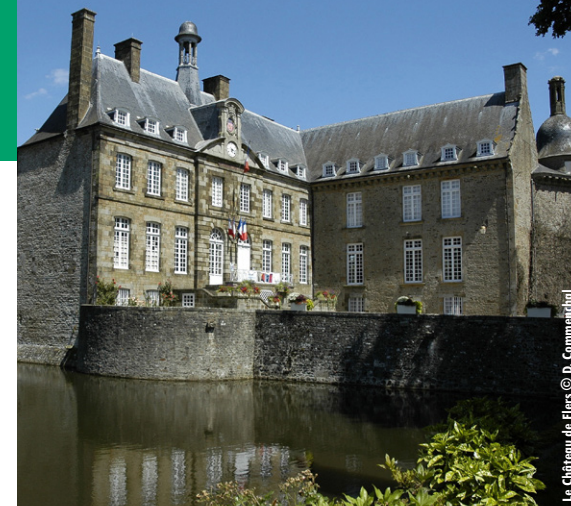
Le Château de Flers

Cerisy-Belle-Étoile, à 8 km au Nord-Ouest de Flers par la D18