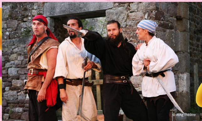
La Vraie Vie des Pirates, un spectacle de Grégory Bron, mis en scène par la Cie AfAg Théâtre et avec AFAG Théâtre. Production Compagnie AfAg Théâtre.