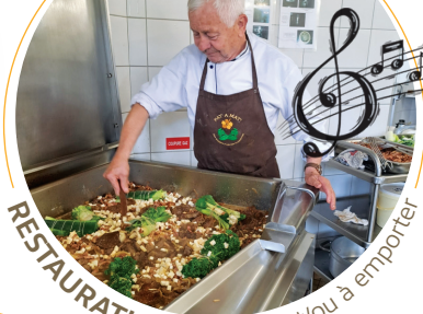
RESTAURATION Sur place et/ou à emporter