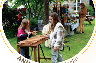
ANIMATIONS au jardin