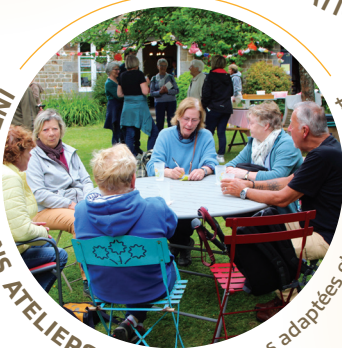
INFORMATIONS ATELIERS Activités physiques adaptées et soins de soins de support