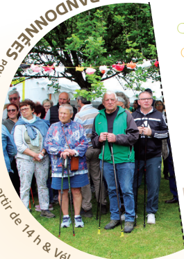
RANDONNÉES pour tous ! Pédestre à partir de 14 h & Vélo à partir de 10 h